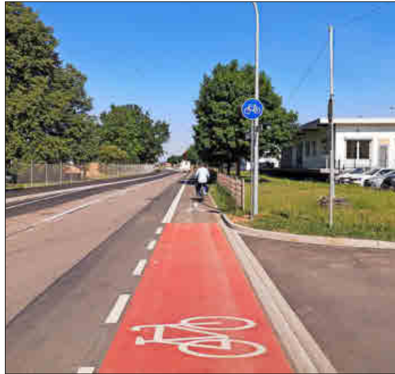
An der Dr.-Georg-Schaeffler-Straße wurde eine Radweglücke geschlossen.

In Lahr hat die Stadtverwaltung in den vergangenen Jahren einige Projekte umgesetzt. Genannt werden in der Pressemeldung der Neubau einer breiteren Geh- und Radwegbrücke am Rosenweg, der straßenbegleitende Radweg an der Dr.-Georg-Schaeffler-Straße und die