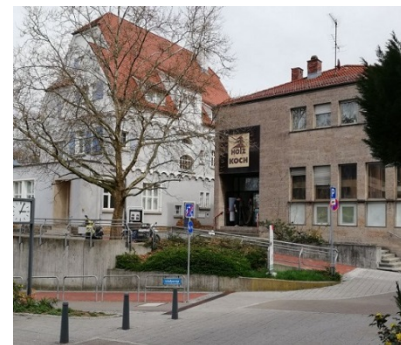
Quartiersfest mit buntem Programm, E-Bikes, Spezialrädern, BMX-Vorführung