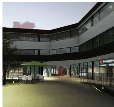
Vorstellung des künftigen Mobilitätspunktes