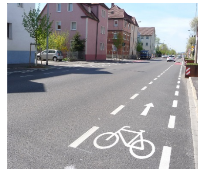
Stadtführung mit dem Rad